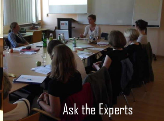
Ask the Experts